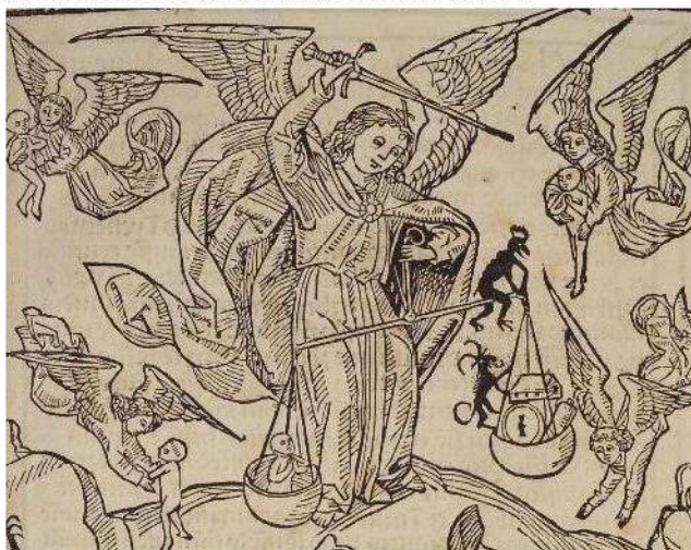
Saint Michel pesant les âmes, détail d'un Jugement dernier, extrait d'un Ars moriendi, vers 1470.

Le 8 mai 2026, vous est proposée à Pontorson, porte du Mont-Saint-Michel et cité liée au Mont et au passage des pèlerins, une journée de Rencontres historiques avec des communications inédites sur les relations entre saint Michel et la mort, dans les textes sacrés, dans le culte et dans l'iconographie. Protecteur du Malin, chef de la Milice céleste, l'archange est aussi celui pèse les âmes au jour du Jugement dernier et celui qui porte les âmes. Ces fonctions sont étroitement associées aux représentations des fins dernières qui animent l'univers médiéval des tympans romans aux livres d'heures de la fin du Moyen Âge et correspondent sans doute à l'une des principales motivations des miquelots.