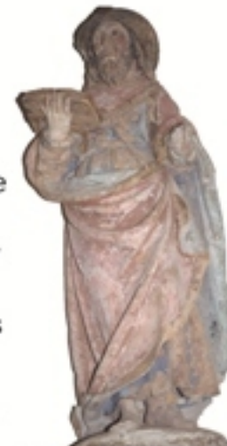
Saint Jacques, Portbail

Une invitation à suivre le Chemin aux Anglais puis à le poursuivre jusqu'à la Merveille !